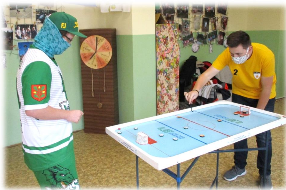
Text a foto – has