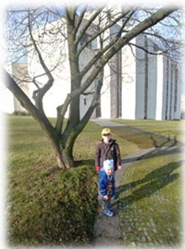
Foto rallye vás zavede na nejrůznější místa našeho města. Každý měsíc je téma jiné, v březnu mostecké budovy, v dubnu vodní plochy a v květnu se vrací téma sochy, těch je totiž v Mostě opravdu hodně. (Ája Laštůvková, foto účastníci akce)