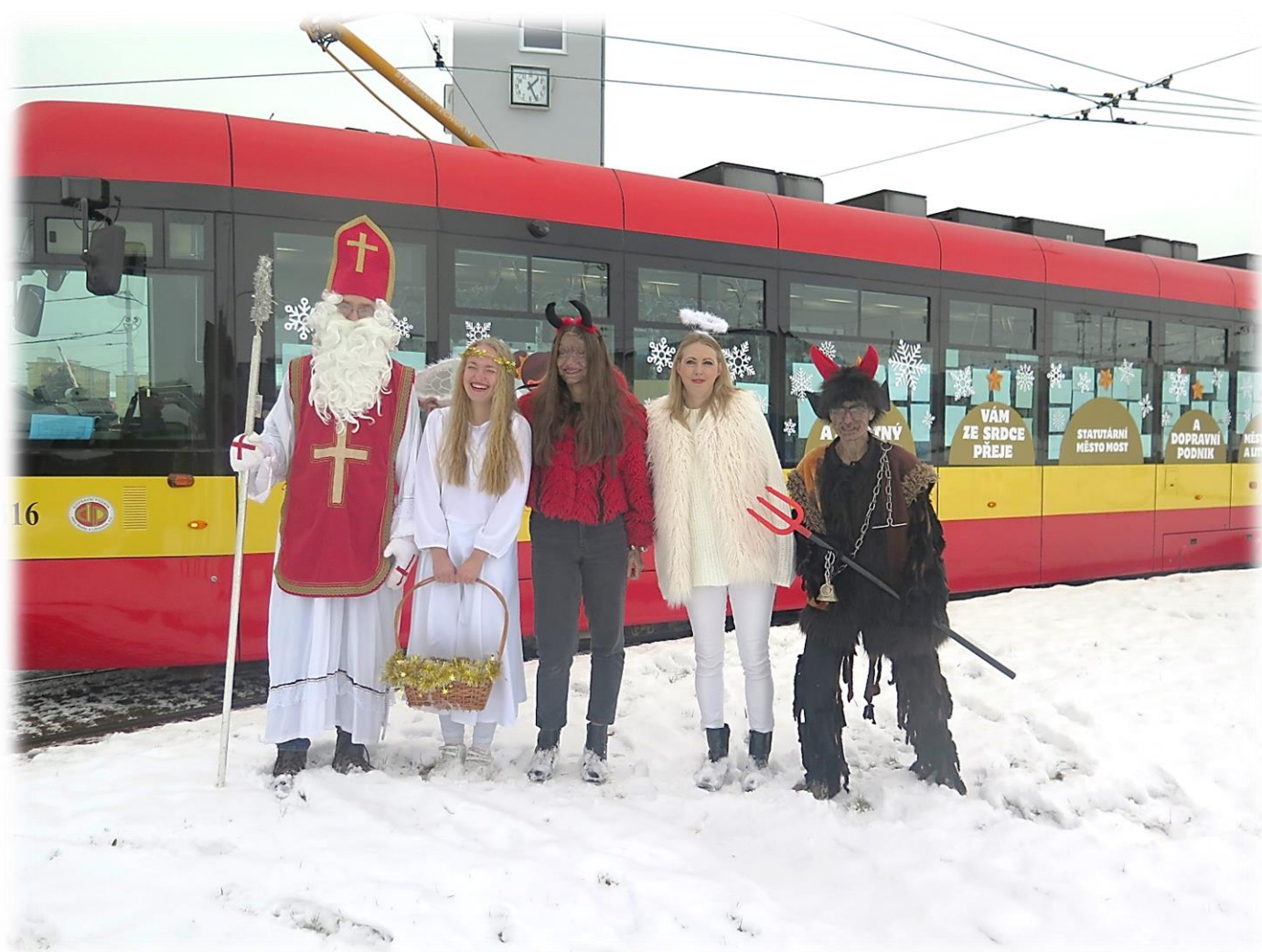
FOTO - MIKULÁŠSKÁ TRAMVAJ 5. PROSINCE 2023

V podpalubí nastalo hrobové ticho. Nikdo ale Odvážného ďábla nelitoval. Všichni se odebrali za svými povinnostmi a těšili se na další vyprávění. Dokonce ani nevím, jestli Odvážný ďábel existoval. Nikdo to neví, a tak zůstává příběh pana Bellamyho navždy zahalen do hávu tajemství. (LB)