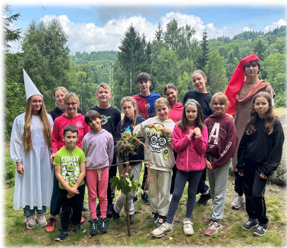
Letní tábor s Ájou - oddílová foto & legenda celotáborové hry